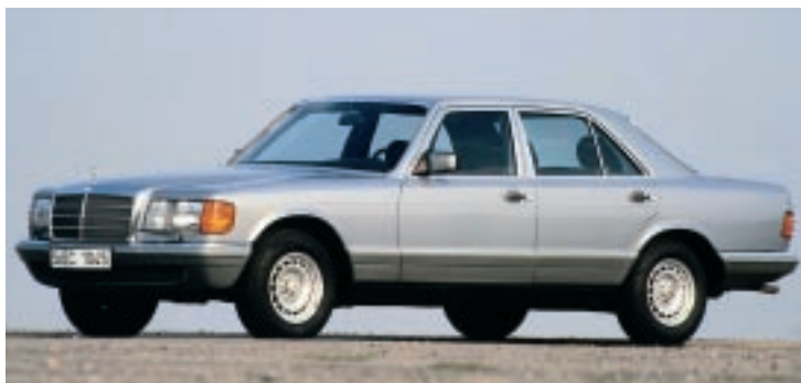
Der W 126 war als Exponat beim Festakt "25 Jahre Airbag" zu bestaunen