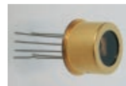
nanoplus Laserdiode im TO8-Gehäuse mit integriertem Peltierelement und Thermistor zur Einstellung der Lasertemperatur